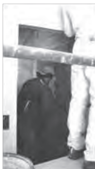
Umbau März 2010, Tannenbodenalp